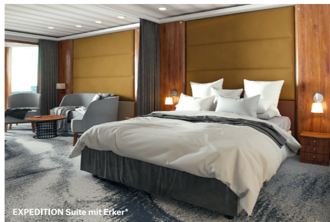
*Illustrierte Darstellung. Das endgültige Design kann abweichen.