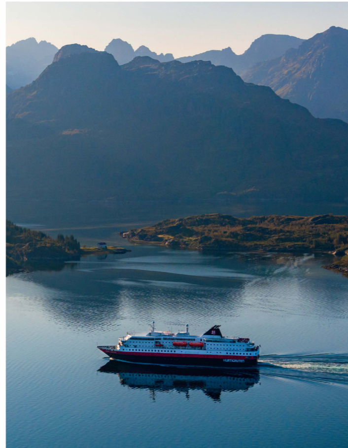
MS KONG HARALD

KABINEN: 216 und 2 Suiten BRZ: 11.204 BAUJAHR: 1993 LÄNGE: 121,8 Meter MODERNISIERUNG: 2016/2023 BREITE: 19,2 Meter WERFT: Volkswerft, Deutschland GESCHWINDIGKEIT: 15 Knoten